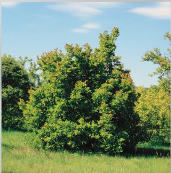
Tatárjuhar az év fája