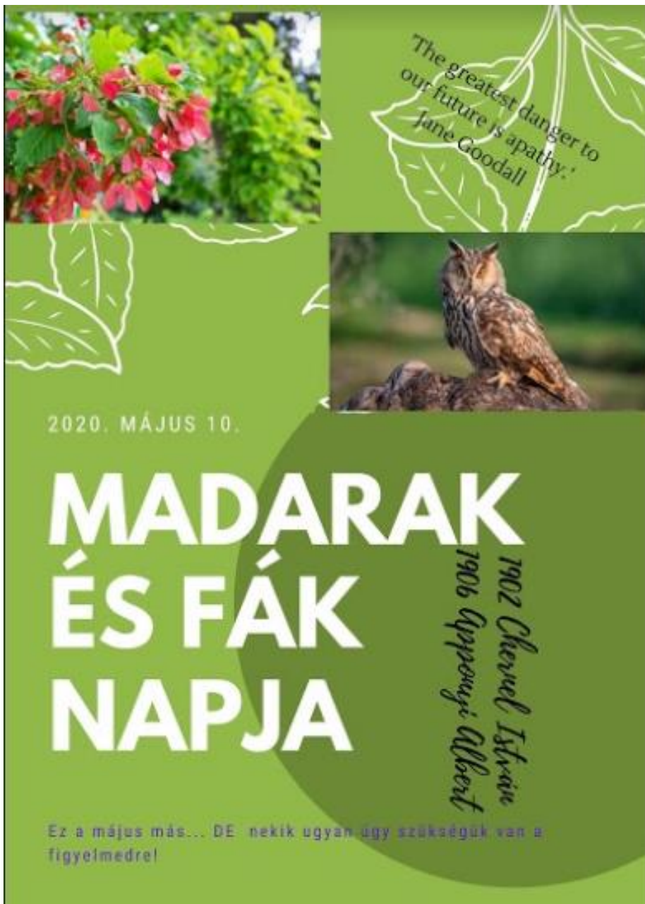
Ötvös Huba munkája