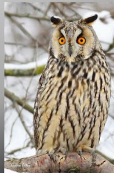
Erdei fülesbagoly az év madara

Vigyázzunk mindannyian a madarakra és a fákra !